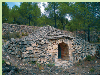
Anjub del Racó de Montalts (M. Solà)