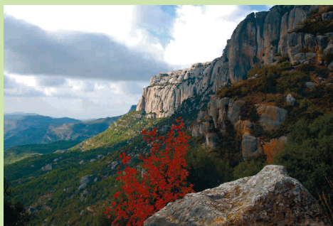
Montsant (B. Roig)