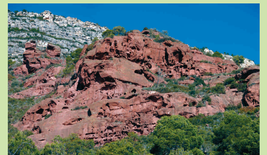
Els Rogerets. La Vilella Baixa (B. Roig)