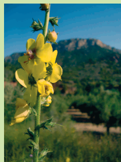
Verbascum virgatum i Ophrys scolopax (M. Montané)